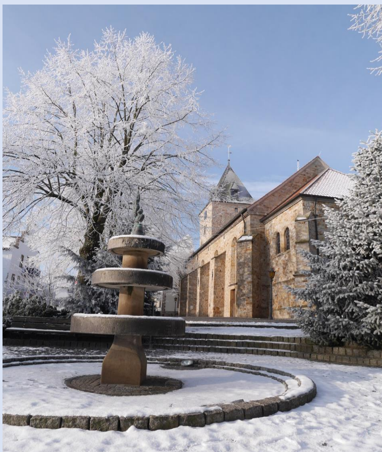
Kirche St. Pankratius, Borgloh

Komm, lass diese Nacht nicht enden, in der wir einen Anfang sehn, lass in uns sie weiterleben und in den Tagen weitergehn, dass die Worte, die gesprochen, mehr als leere Worte sind, dass der Weg, der hier begonnen, nicht im Sand verläuft, dass die Träne, die vergossen, nicht umsonst herunterrinnt, dass die Kraft, die hier gefunden, nicht im Keim erstickt, dass das Lied, das hier gesungen, auf den Straßen weiterklingt, dass die Hoffnung, die geboren, morgen größer wird. (Hans-Jürgen Netz)